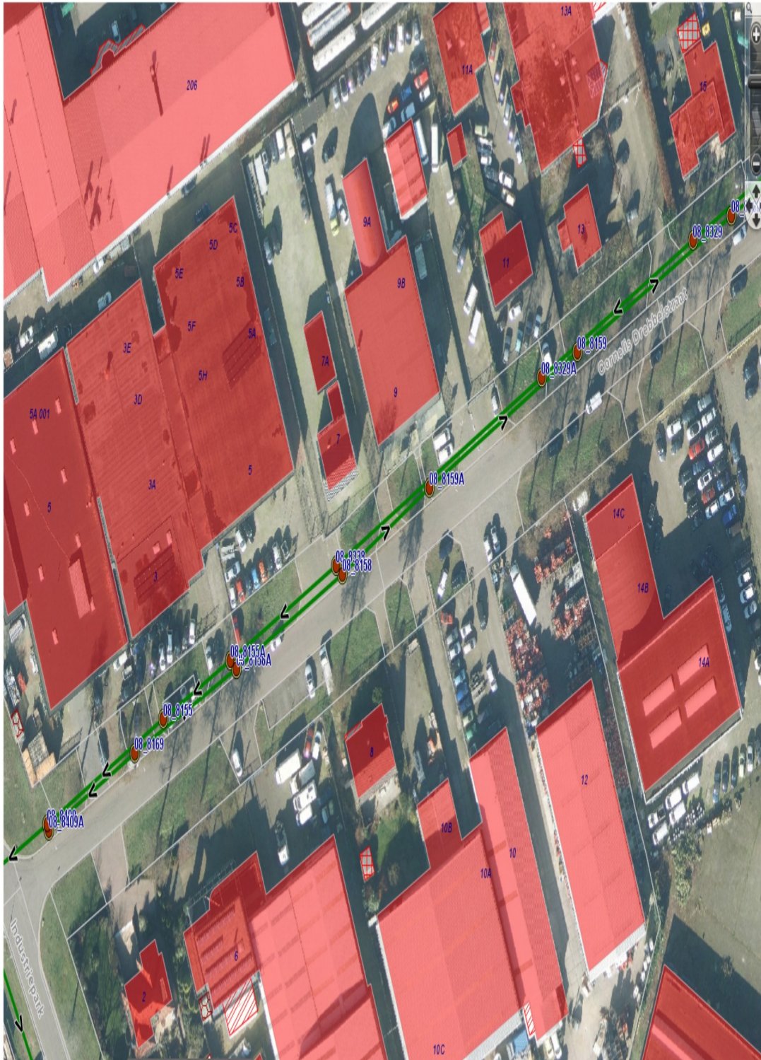
Figuur 1 Monsterlocaties aan de [redacted] in Wijchen. De groene lijnen geven de rioolleidingen weer: de noordelijke stroomt in zuidwestelijke richting, de zuidelijke in noordoostelijke richting. Deze zuidelijke rioolleiding is via een lus verbonden met de noordelijke. Het rioolwater verlaat de [redacted] in het zuidwesten bij rioolput 08_8409. Het bedrijf bevindt zich op nummer 12 en loost op beide rioolleidingen.